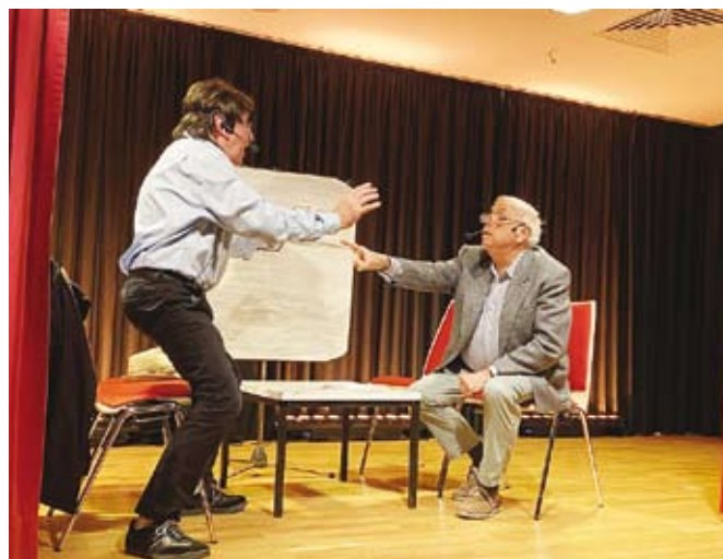
Sketch der Theatergruppe