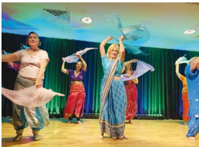
Zauberhafte Orientalische Goldies