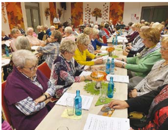
Alle Gäste singen begeistert mit