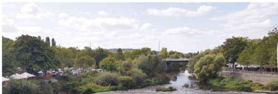
Hier eine kleine Bildauswahl von verschiedenen WHH-Fahrten