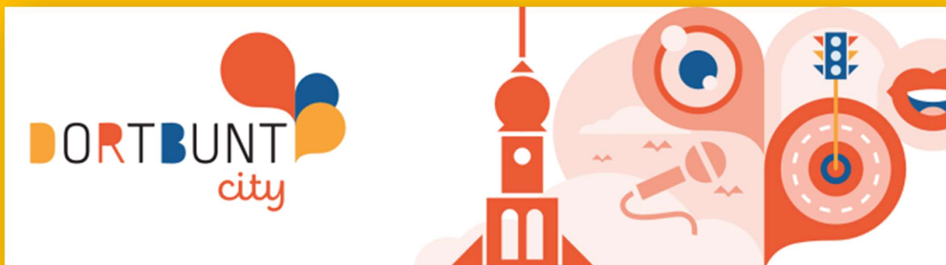
Logo: Dortmund Agentur